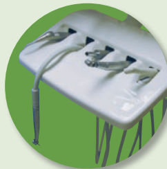
Koncovka nespadne na zem.